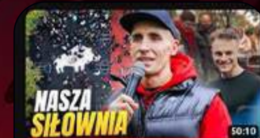
OTWIERAMY SIĘĆ DARMOWYCH SIŁOWNI W CALEJ POLSCE!