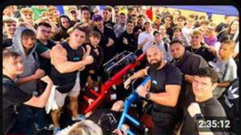
OTWIERAMY NOWĄ SIŁOWNIĘ DZIK GYM X DECATHLON - LIVE