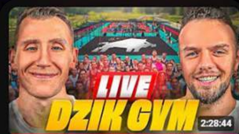
OTWARCIE DARMOWEJ SIŁOWNI DZIK GYM W OLSZTYNIE