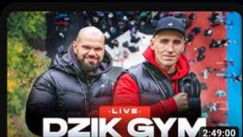
WIELKIE DOKRĘCANIE ŚRUBY NA NASZEJ DARMOWEJ SIŁOWNI DZIK GYM