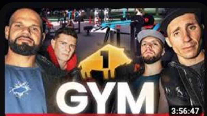
DZIK GYM - OTWARCIE PIERWSZEJ DARMOWEJ SIŁOWNI 24/7 LIVE